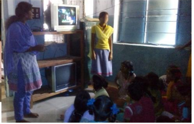
அன்னை சத்தியா அரசு குழந்தைகள் காப்பக மாணவர்கள்

தமிழக அரசின் சமூகநலம் மற்றும் சத்துணவுத் திட்டத் துறையின் கீழ் ஒவ்வொரு மாவட்டத்திற்கும் ஒரு குழந்தைகள் காப்பகம், அன்னை சத்தியா அரசு குழந்தைகள் காப்பகம் என்னும் பெயரில் இயங்குகிறது. மதுரை மாவட்டத்திற்கான குழந்தைகள் காப்பகத்தில் அந்த மாவட்டத்தின் வெவ்வேறு பகுதியைச் சேர்ந்த ஆதரவற்ற 125 மாணவிகள் தங்கி மதுரையிலுள்ள உயர்நிலை / மேல்நிலைப் பள்ளிகளில் பயில்கின்றனர். இவர்கள், ஒவ்வொரு சனிக்கிழமையும் ஒப்பானவரோடு கற்றல் (Peer Learning) முறையில் தமக்குத்தாமே வழிநடத்தி தளிர்த்திறன் திட்டப் பாடங்களின் வழியாக வாழ்க்கைத் திறன் கல்வியை கடந்த ஓராண்டாக பெற்றுவருகின்றனர்.