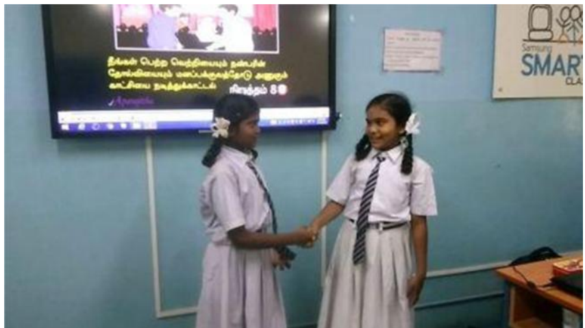
ஐவகர் நவோதயா பள்ளி பெரியகாலாப்பட்டு

அடுத்த கல்வியாண்டில் இப்பள்ளிகள் பலவற்றிலும் தொடங்குவதற்காக முயற்சிகள் மேற்கொள்ளப்பட்டு வருகின்றன.